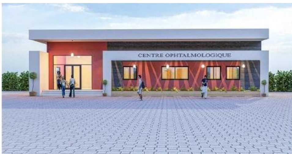
Vue sur la facade principale