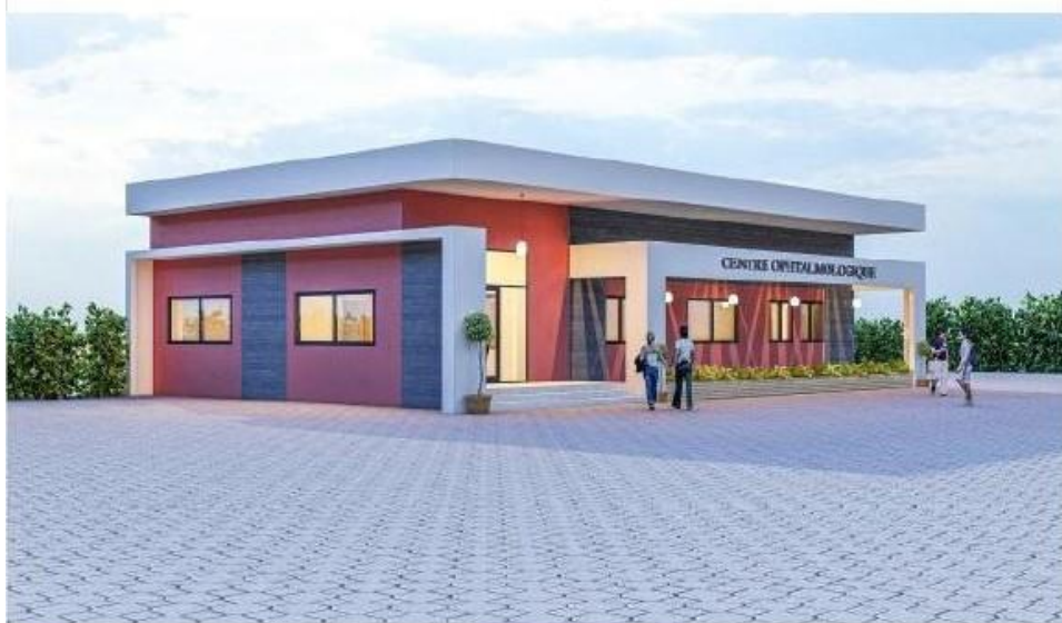
Vue sur la façade latérale gauche

Superato il periodo iniziale di avviamento che richiederà aiuti economici esterni, a regime, il Centro si autofinanzierà con la vendita di prodotti farmaceutici (come avviene nei nostri CSPP).