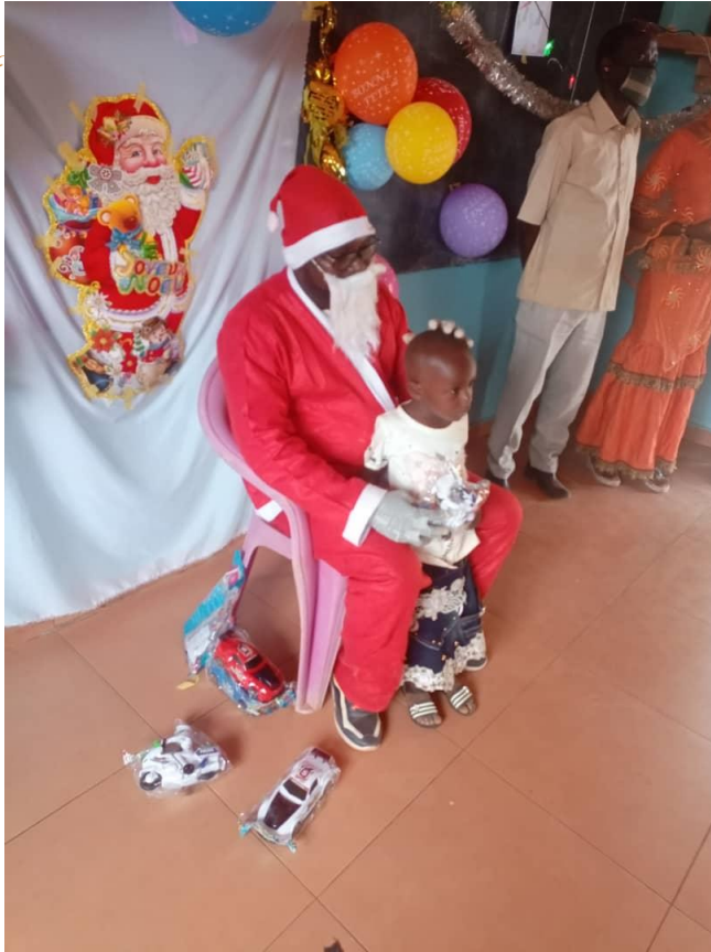
Alla scuola di Djicofé, i bambini dell'asilo hanno avuto il privilegio di incontrare Babbo Natale – nero – con palloncini e regali per tutti.