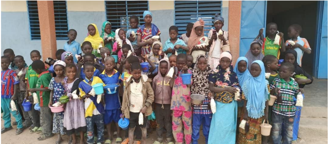
Il 21 dicembre i ragazzi della Scuola di Pikioko sono intervenuti numerosi all'Arbre de Noel regalato dalla Queen of Peace. Tutti con un secchiello in mano da riempire con cibo caldo.