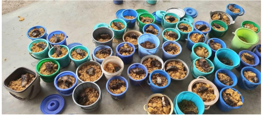
E soprattutto porzioni generose di cous cous e pesce per tutti.