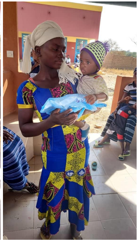
A tutte le latitudini del mondo ai maschietti due macchinine sono sempre gradite.