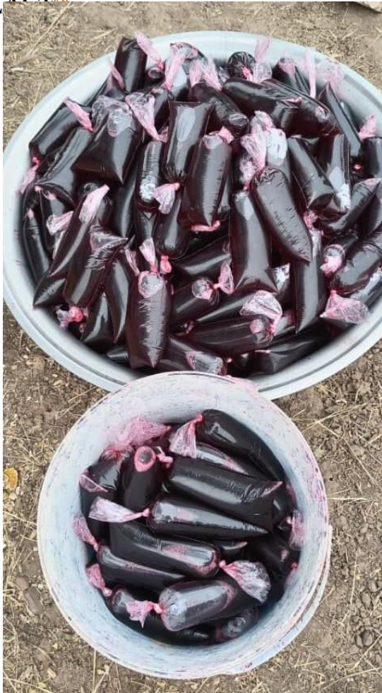
e da bere : sacchetti di succo di tamarindo.