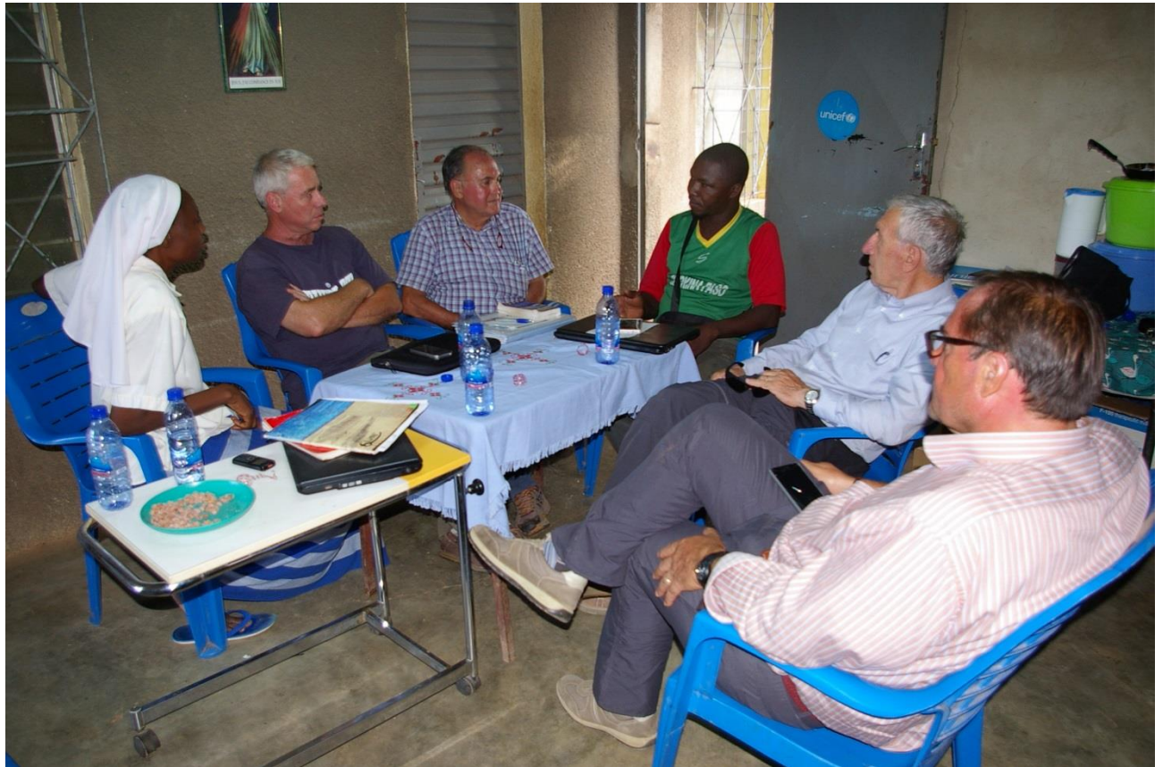
Seduta di pianificazione lavori prima di ripartire...