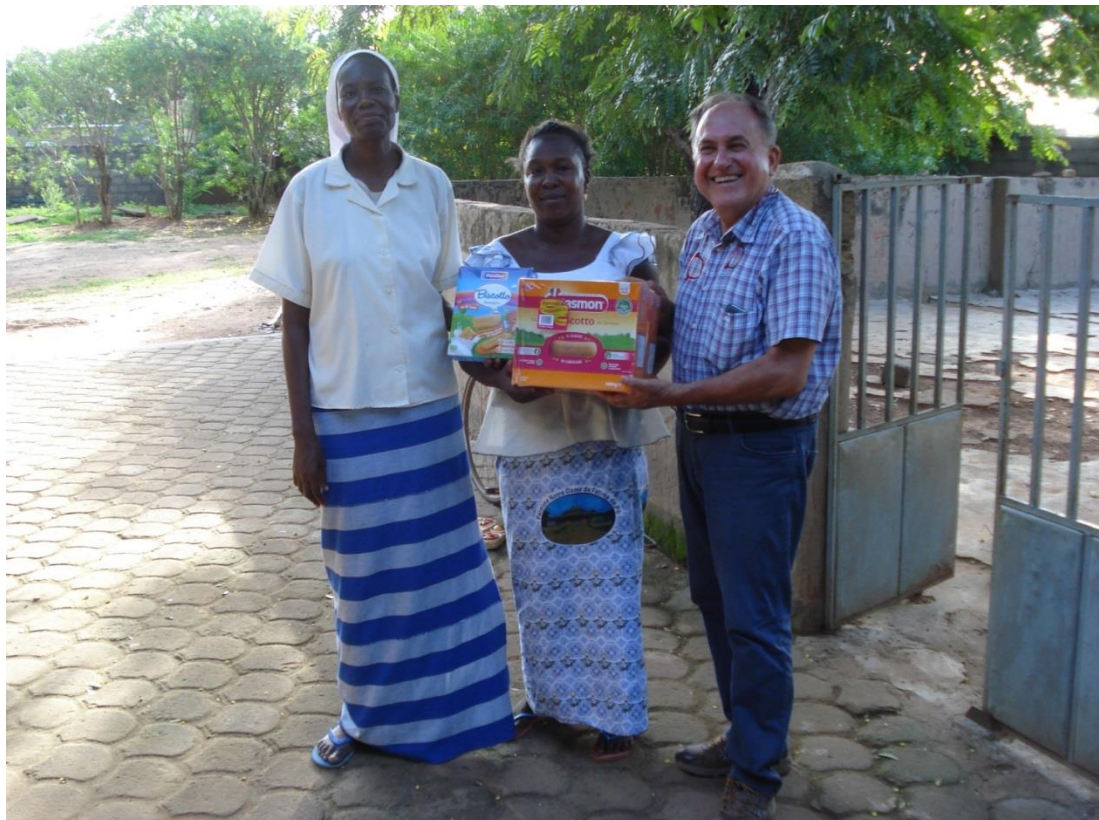
... e aiuti concreti per i bambini malnutriti inviati dall'Italia.